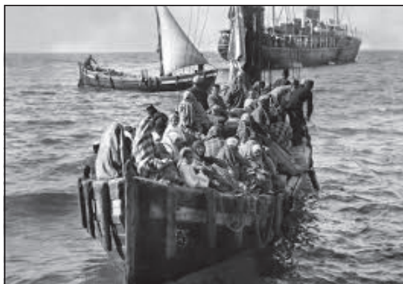
Πρόσφυγες καταφτάνουν στη μητέρα πατρίδα

Η απόστασή τους από τη Θεσσαλονίκη είναι 50 χιλιό-