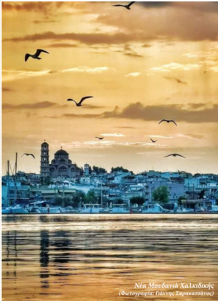
Νέα Μουδανιά Χαλκιδικής

Η προσφυγομάνα Χαλκιδική μας φιλοξένησε, στις παράκτιες περιοχές της, έναν μεγάλο αριθμό προσφύγων, που, κάτω από αντίξοες συνθήκες, κατόρθωσαν, όχι απλώς να επιβιώσουν, αλλά και να μεγαλοουργήσουν. Ζωντανό παράδειγμα και οι πρόσφυγες των Νέων Μουδανιών.