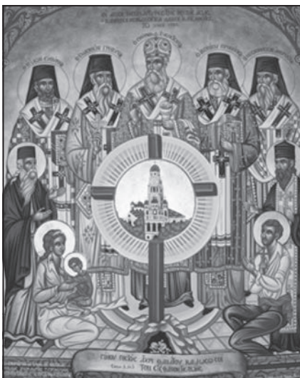
Εικ. 3. Οι 5 μητροπολίτες ιερομάρτυρες της Μικρασιατικής καταστροφής με εκπρόσωπους των σφαγιασθέντων Μοναχών, Ιερέων και μελών της Χριστιανικής Οικογένειας

Άγιος Παΐσιος ο Αγιορείτης (1924 - 1994 μ.Χ.): γεννημένος στα Φάρασα, μόνασε στο Άγιον Όρος.