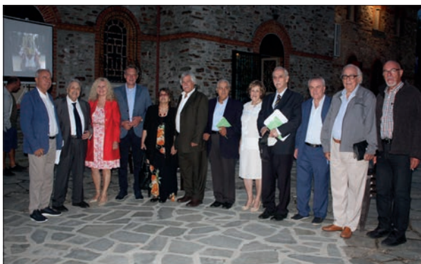
Μέλη του Διοικητικού Συμβουλίου του Παγκληδικού, με τον εκδότη, τους παρουσιαστές και λοιπούς καλεσμένους.