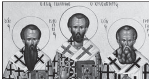
Εικ. 2. Οι τρεις Ιεράρχες της Εκκλησίας μας: Άγιος Βασίλειος (Νεοκαισάρεια Πόντου), Άγιος Ιωάννης Χρυσόστομος (Αντιόχεια), Άγιος Γρηγόριος ο Θεολόγος (Καππαδοκία)

Τιμώντας την επέτειο των 100 χρόνων από τη Μικρασιατική καταστροφή, η Ιερά Μονή Αγίου Κοσμά του Αιτωλού (Αρναία) αφιέρωσε το φετινό ημερολόγιο της στους Αγίους της Μ. Ασίας. Μια αναλυτική μελέτη του αναδεικνύει 151(!) Αγίους και 223(!) Οσίους της Εκκλησίας μας. Ανάμεσα στους Αγίους αναγνωρί-