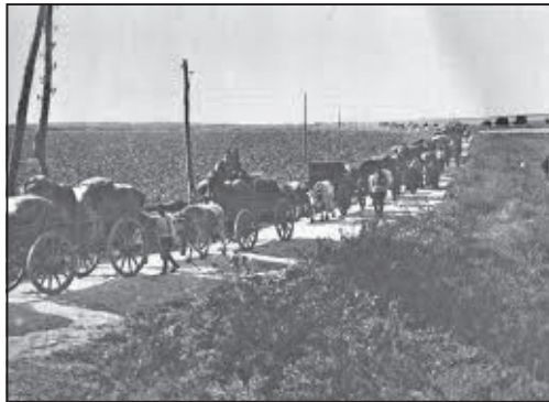
Ο δρόμος της προσφυγιάς

Η Οθωμανική Αυτοκρατορία είναι με την πλευρά των ηττημένων, και χάνει σημαντικό μέρος των εδαφών της. Η Συνθήκη των Σεβρών, του Ιουλίου 1920, δίνει στην Ελλάδα ως κανονικό έδαφος, δηλαδή με