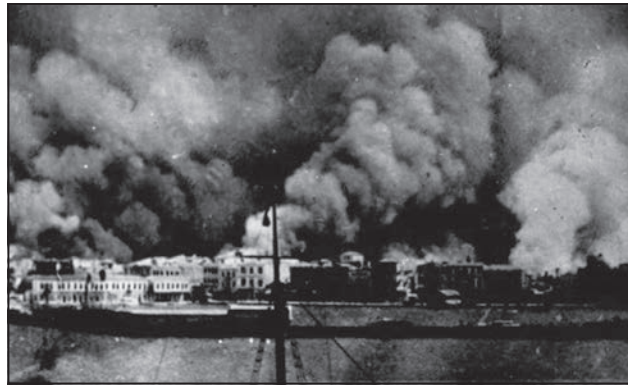
Η πυρπόληση της Σμύρνης

Μετά τη Μικρασιατική καταστροφή και την αποχώρηση της στρατιάς της Θράκης, ακολουθεί η υπογραφή της πολυσυζητημένης Συνθήκης της Λωζάνης, με 143 άρθρα, στις 24 Ιουλίου 1923 , η οποία κατήργησε τη Συνθήκη των Σεβρών. Μετά από σκληρές, επίπονες και μακράς διάρκειας διαπραγματεύσεις, από τον Οκτώβριο 1922, μεταξύ των αντιπροσωπειών, της Ελληνικής υπό τον Ελευθέριο Βενιζέλο και της Τουρκικής υπό τον Πασά Ισμέτ, κάτω από την εποπτεία και πιέσεις των Συμμάχων, την 03:30 ώρα της 24ης Ιουλίου 1923 και στη μεγάλη αίθουσα του Πανεπιστημίου της Λωζάνης, έλαβε χώρα η επίσημη τελετή της υπογραφής