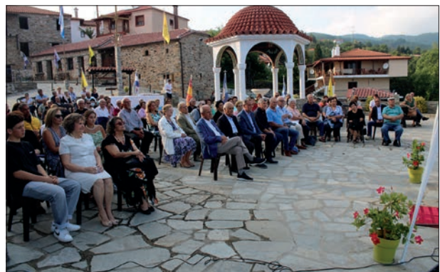
Άποψη του ακροατηρίου