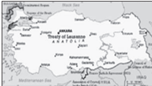
Σύνορα της Τουρκίας, που ορίζονται από τη Συνθήκη της Λωζάνης

στο ότι, κατά την οθωμανική αυτοκρατορία, η θρησκεία μετρούσε πολύ περισσότερο από ό,τι η εθνικότητα και, από την άλλη πλευρά, η Τουρκία ήθελε όλοι οι μουσουλμάνοι της Δυτικής Θράκης να παραμείνουν. Μεταξύ των ανταλλάξιμων περιλαμβάνονταν επίσης οι Έλληνες του Πόντου, αλλά και τουρκόφωνοι Έλληνες, όπως τουρκόφωνοι Πόντιοι και Καραμανλήδες, καθώς και ελληνόφωνοι μουσουλμάνοι, όπως Τουρκοκρητικοί και Βαλαάδες της Δυτικής Μακεδονίας. Μαζί με τους Έλληνες, πέρασε στην Ελλάδα και αριθμός Αρμενίων και Συροχαλδαίων. Εξαιρέθηκαν από την ανταλλαγή οι Ρωμιοί κάτοικοι της νομαρχίας της Κωνσταντινούπολης (οι 125.000 μόνιμοι κάτοικοι της Κωνσταντινούπολης, των Πριγκηπονήσων και των περιχώρων, οι οποίοι ήταν εγκατεστημένοι πριν από τις 30 Οκτωβρίου του 1918) και οι κάτοικοι της Ίμβρου και της Τενέδου (6.000 κάτοικοι), ενώ στην Ελλάδα παρέμειναν 110.000 Μουσουλμάνοι της Δυτικής Θράκης.