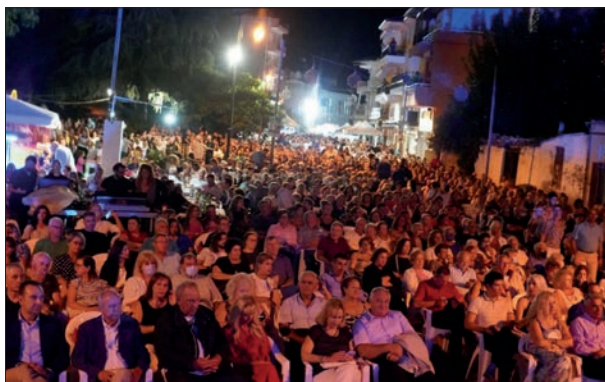
Άποψη του ακροατηρίου