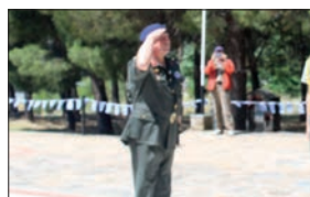
Από τον Στρατηγό Γ' Σ.Σ. κ. Σωτήριο Κωστάκογλου