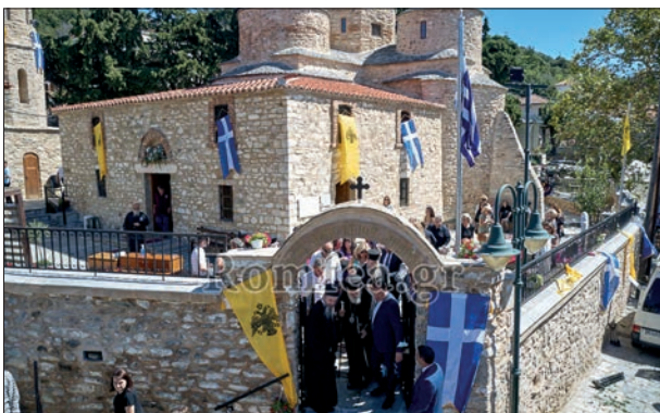
Άποψη του Ι.Ν. Αγ. Ανδρέα Περιστεράς, μετά τα εγκαίνια