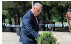
Από τον Αντιπεριφερειάρχη κ. Ιωάννη Γιώργο