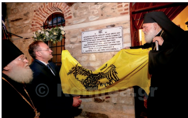
Από τα αποκαλυπτήρια της αναμνηστικής πλάκας των θυρανοίξιων