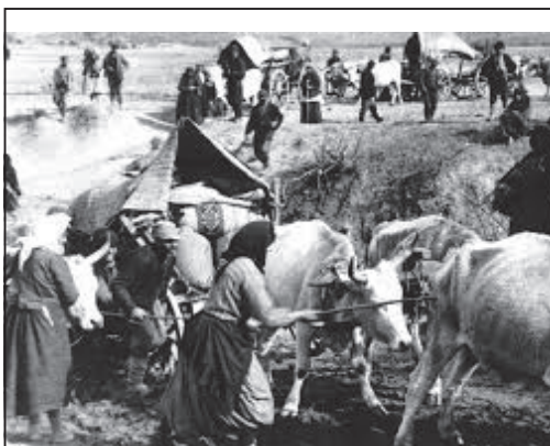
Πρόσφυγες με τα λιγοστά υπάρχοντά τους

Οι πρώτοι κάτοικοι του διαμερίσματος ήταν πρόσφυγες από το νησί της Τενέδου. Σήμερα η Νέα Τένεδος αριθμεί 310, (απογραφή 2011) κατοίκους, που ασχολούνται κυρίως με τη γεωργία και τη κτηνοτροφία. Στην απογραφή του 1928, είχε 216 κατοίκους.