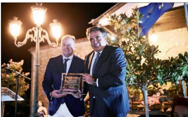
Επίδοση τιμητικής πλακέτας