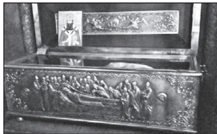
Η Λάρνακα του Αγίου Θεωνά

Ο Άγιος Θεωνάς, ώς Ήγουμένος, «έστερέωσε καλώς» τό κοινόβιο Μοναστήρι «και κατά τόν τύπον και τά άσκητικά του Μεγάλου Βασιλείου έρρυθμισε και έκανόνισε τούς μαθητάς του νά πολιτεύονται». Μετά από όλες αυτές τίς ένέργειες και δραστηριότητες, γιά τήν ήσυχία του και γιά τήν άμεσότερη επικοινωνία του μέ τόν Θεό, έκτισε άσκητήριο στό βουνό Άφανάς (βλ. εικόνα), πού ύψώνεται πάνω από τό Μοναστήρι, προς ΒΑ του, και απέχει από αυτό ¾ τής ώρας πεζοπορώντας. Τό άσκητήριο αυτό είναι ύπο-