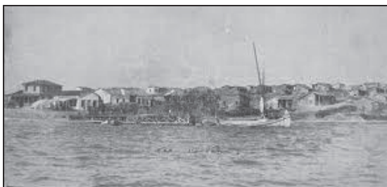
Στο Καργί Λιμάνι

Σε μικρή απόσταση από το χωριό, στο ύψωμα όπου σήμερα το Πνευματικό Κέντρο της γυναικείας μονής της