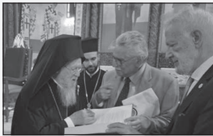
Ο Πρόεδρος της Ε.Μ.Σ. Δρ Βασίλειος Ν. Πάππας προσφέρει στην Α.Θ.Π. Οικουμενικό Πατριάρχη Κωνσταντινουπόλεως κ.κ. Βαρθολομαίο τον Επετειακό Τόμο των 80 χρόνων της Ε.Μ.Σ., κατά την πρόσφατη επίσκεψη του Πατριάρχη στη Θεσσαλονίκη

Με μεγάλη χαρά, τιμή και αγάπη υποδεχόμεθα σήμερα την Υμετέρα Σεπτή Κορυφή της Ορθοδόξου Εκκλησίας, τον πνευματικό ηγέτη του Γένους μας, τον Πατέρα και Ποιμένα των απανταχού της γης Ορθοδόξων Χριστιανών, στην λαμπρή αυτή αίθουσα τελετών του Αριστοτελείου Πανεπιστημίου, της βυζαντινής πόλεως του Μεγαλομάρτυρος Αγίου Δημητρίου του Μυροβλήτου. Ανταποκριθήκαμε άμεσα και με μεγάλο ενδιαφέρον, ως διοίκηση της ιστορικής Εταιρείας Μακεδονικών Σπουδών, στην πρόσκληση των κύριων διοργανωτών του παρόντος Διεθνούς Συνεδρίου, της Θεολογικής μας Σχολής και του Πατριαρχικού Ίδρυματος Πατερικών Μελετών, στο Διοικητικό Συμβούλιο του οποίου η Παναγιότης σας, μου έχει επιδαμυλεύσει την τιμή της συμμετοχής στην οργάνωση του παρόντος Διεθνούς Συνεδρίου, επ' αφορμή της 30ετούς ευδοκίμου πατριαρχικής οιακοστροφίας Σας.»