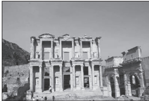
Εικ. 1. Ερείπια της Βιβλιοθήκης της Περγάμου

Αν και η ιστορία της Τροίας ξεκινά την 3η π.Χ. χιλιετία, οι πρώτες επιβεβαιωμένες καταγραφές αποίκησης των παραλίων της Μικράς Ασίας αναφέρονται στον 11ο π.Χ. αι. Ίωνες, Αιολείς και Δωριείς, από την Ήπειρο και τη Θεσσαλία, έφθασαν ως τις ακτές της Μ. Ασίας, όπου έκτισαν πόλεις και εγκαθίδρυσαν έναν αξιόλογο πολιτισμό, που, σε πολλές περιπτώσεις, προπορεύθηκε εκείνου της ηπειρωτικής Ελλάδας. Χάρη στη φιλοσοφική σκέψη, που παρήγαγε, η ανάπτυξη του πολιτισμού αυτού θεωρείται από τους ιστορικούς