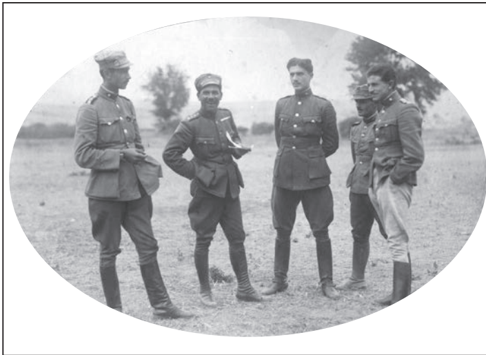
Ο Χριστόδουλος Γερογιάννης (στο κέντρο) με συναδέλφους, κάπου στο μέτωπο

Διετέλεσε καθηγητής της Οχρωματικής στη Σχολή Ευελπίδων, καθηγητής της Τοπογραφίας, υπεύθυνος της οχύρωσης της χώρας στο ΓΕΣ, υπεύθυνος της βιομηχανικής επιστράτευσης της χώρας, διοικητής της Σχολής Μηχανικού, αρχηγός Μηχανικού στο ΓΕΣ, διοικητής του Στρατηγείου Κεντρικής Ελλάδας κ.ά. Διετέλεσε, επίσης, σημαίνον στέλεχος της Διεθνούς Επιτροπής Διαχάραξης Συνόρων της Συνθήκης της Λωζάνης στο «τριεθνές» και στο «δέλτα» του Έβρου (1926) και αρχηγός της ελληνικής αντιπροσωπείας στη Μικτή Ελληνοβουλγαρική Επιτροπή Οριστικής Αποκατάστασης των Συνόρων (1953).