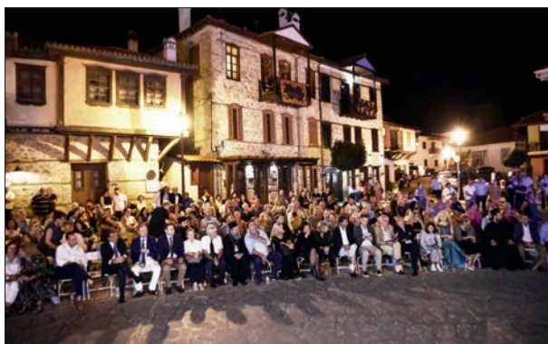
Άποψη του ακροατηρίου