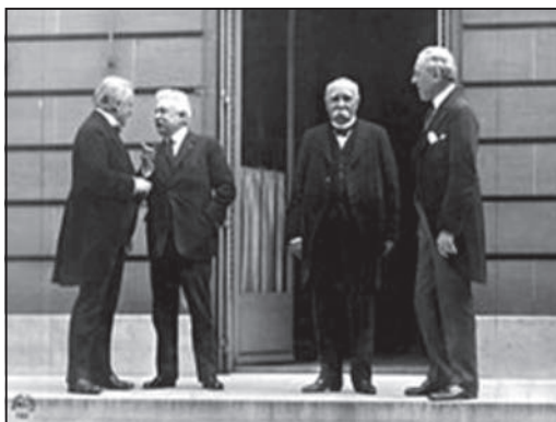
Το Συμβούλιο των Τεσσάρων στη Σύνοδο Ειρήνης: Λόιντ Τζορτζ, Βιττόριο Ορλάντο, Ζωρζ Κλεμανσώ και Γούντροου Ουίλσον

Στις 12 Ιανουαρίου 1919, συνήλθε η Σύνοδος Ειρήνης του Παρισιού, η οποία ήταν μια πολυεθνής σύνοδος, που οργανώθηκε από τις νικήτριες συμμαχικές δυνάμεις της Αντάντ και των ΗΠΑ, στο τέλος του Α΄ Παγκοσμίου Πολέμου, προκειμένου, αφενός, να συ-