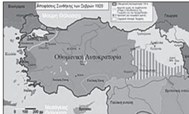
Χάρτης των εδαφών, που παραχωρούνταν στην Ελλάδα με τη Συνθήκη των Σεβρών

Και ενώ αυτά συνέβαιναν στη Σμύρνη και στην ανατολική Θράκη, στην καρδιά της Οθωμανικής Αυτοκρατορίας, στην Κωνσταντινούπολη, σημειώνονταν εντυπωσιακές εξελίξεις. Ο Μουσταφά Κεμάλ στάλθηκε με εντολή του Σουλτάνου, υπό την ιδιότητα του Επιθεωρητή των Στρατευμάτων, στην περιοχή του Πόντου, για να εξοντώσει τις ανταρτικές ομάδες, που αντιτίθονταν στον Σουλτάνο και στους όρους της ανακωχής του Μούδρου. Ωστόσο, αντί να καταπνίξει το εθνικιστικό κίνημα, ο Κεμάλ ανέλαβε τελικά την ηγεσία του. Στις 19 Μαΐου του 1919, αποβιβάστηκε στη Σαμψούντα, ξεκινώντας την προσπάθεια οργάνωσης του αντιστασιακού κινήματος. Από την παραλιακή πόλη του Ευξείνου