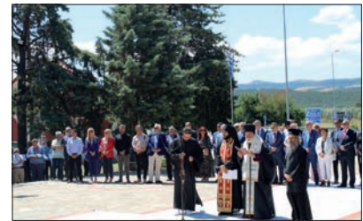
Επιμνημόσυνη δέηση στο Μνημείο