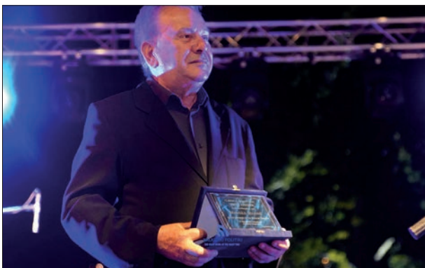
Επίδοση τιμητικής πλακέτας