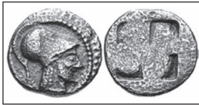
Νόμισμα της Αίνειας, με το πορτρέτο του Αινεία. Περί το 510-480 π.Χ.

νομίσματα, που απεικονίζουν τον πρώτο Μικρασιάτη συντοπίτη τους πρόσφυγα, που κατέπλευσε στη Χαλκιδική, τον Αινεία.