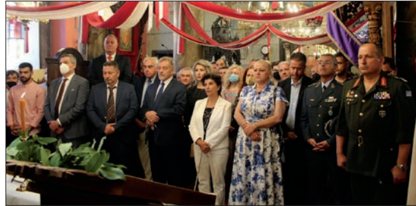
Οι καλεσμένοι στο καθολικό της Μονής